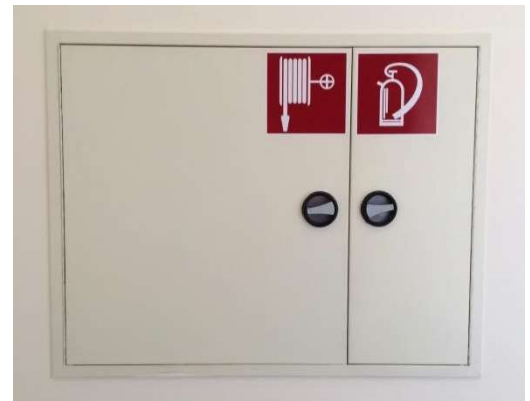
Abb. 4.4.1: Wandhydrantenkasten (hier mit Feuerlöscher kombiniert)

Machen Sie sich mit deren richtiger Handhabung und Aufstellungsort vertraut. Diese sind nicht nur für die Feuerwehr vorbereitet, sondern ähnlich einem Feuerlöscher für jedermann zugänglich, um einen Brand in der Entstehungsphase bekämpfen zu können.