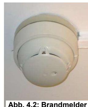
Abb. 4.2: Brandmelder

⇒ Eine Fehlauflösung ist vom Verursacher, je nach Vorschreibung, an die Akademikerhilfe zu bezahlen.