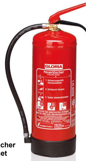
Abb. 4.3: Handfeuerlöscher