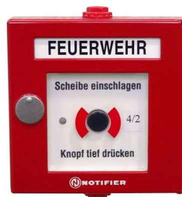
Abb. 4.1: Druckknopfmelder

Im gesamten Haus sind bei den Aus- und Notausgängen sowie den Zugängen zu den Stiegen Druckknopfmelder installiert (rotes Kästchen mit weißem Grund und schwarzem Knopf). Diese Melder lösen den Brandalarm aus. Bei Betätigung des Melders wird nicht nur im Haus (Sirene) Alarm ausgelöst, sondern auch direkt und unmittelbar die Feuerwehr alarmiert. Jede(r) BewohnerIn ist verpflichtet, sich die Lage des nächstgelegenen Druckknopf-melders einzuprägen und diesen bei Entdecken eines Brandes zu betätigen.