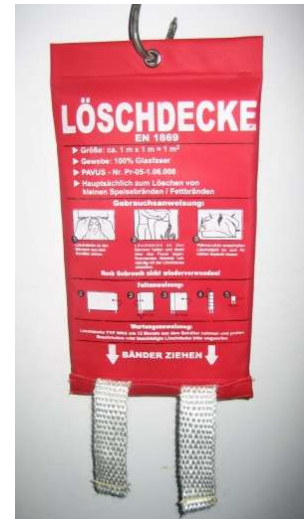
Abb. 4.5: Löschdecke