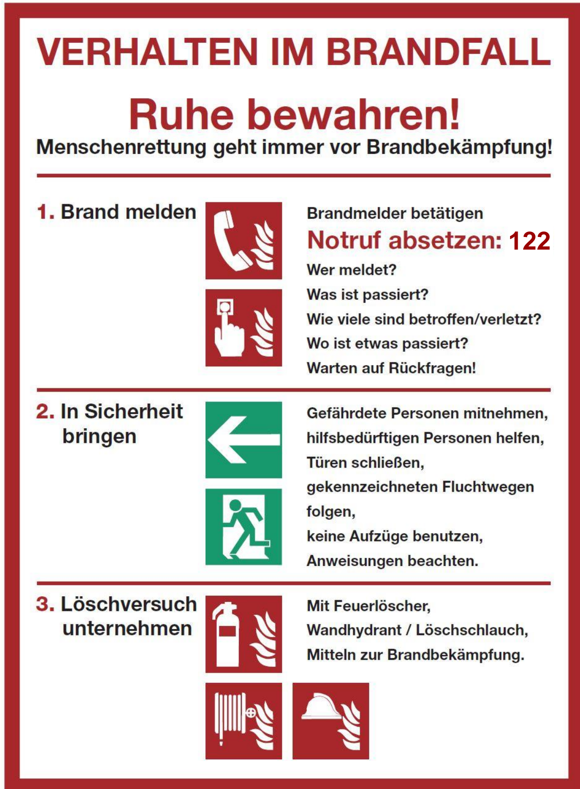
Abb. 5.2: Verhalten im Brandfall