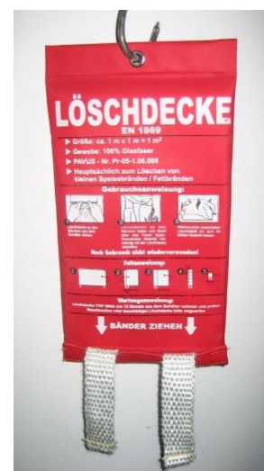
Abb. 4.3: Löschdecke