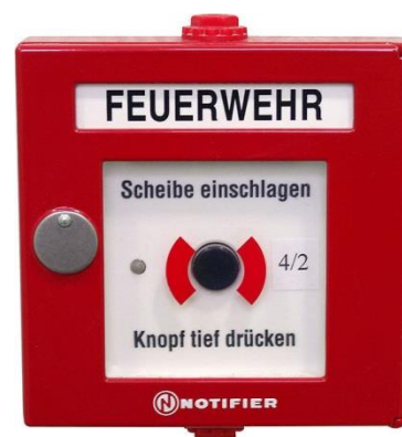
Abb. 4.1: Druckknopfmelder

Im gesamten Haus sind je Geschoss im Stiegenhaus Druckknopfmelder installiert (rotes Kästchen mit weißem Grund und schwarzem Knopf). Bei Betätigung des Melders kommt es zu einem Hausalarm (Sirene) Dieser wird jedoch nicht unmittelbar an die Feuerwehr oder eine andere Einsatzorganisationen weitergeleitet. Bei einem Notfall alarmieren sie damit nur die Hausbewohner. Zusätzlich sollte immer ein Notruf unter der Nummer 122 über Telefon abgesetzt werden Jede(r) BewohnerIn ist verpflichtet, sich die Lage des nächstgelegenen Druckknopfmelders einzuprägen und diesen bei Entdecken eines Brandes zu betätigen.