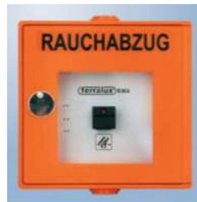
Abb. 4.3: Rauchabzugstaster

Der Rauchabzugstaster bewirkt keine automatische Alarmmeldung der Feuerwehr wie die Druckknopfmelder. Betätigen Sie daher im Ernstfall zusätzlich Druckknopfmelder und alarmieren sie die Feuerwehr via Telefon.