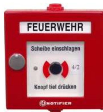
Abb. 4.1: Druckknopfmelder

Jede(r) BewohnerIn ist verpflichtet, sich die Lage des nächstgelegenen Druckknopfmelders einzuprägen und diesen bei Entdecken eines Brandes zu betätigen