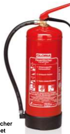
Abb. 4.2: Handfeuerlöscher