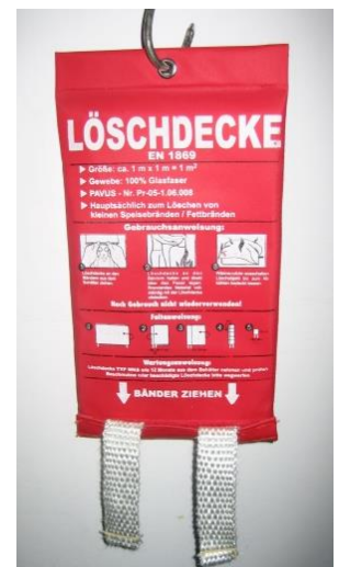
Abb. 4.3: Löschdecke