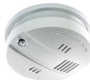
Abb. 4.4: Rauchwarnmelder

Die Melder sind batteriebetrieben, ein Kontrolllämpchen blinkt regelmäßig. Rechtzeitig vor dem Leerwerden der Batterie ertönt ein Signal. Ist diese der Fall, muss die Heimleitung verständigt werden, um die Batterie zu wechseln.