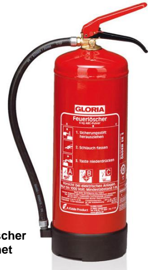
Abb. 4.1: Handfeuerlöscher