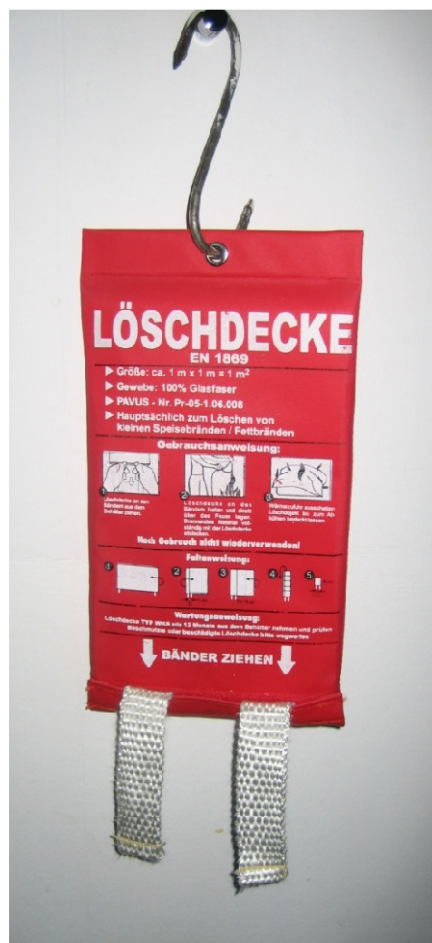
Abbildung 4: Löschdecke