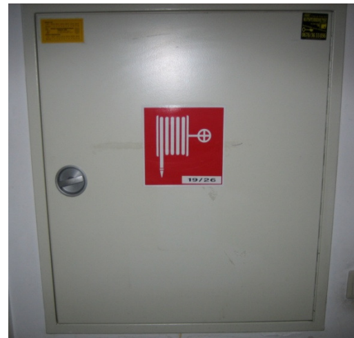
Abbildung 2: Wandhydrantenkasten

Wandhydranten sind im Gebäude installierte Wasserentnahmestellen, die zur Brandbekämpfung vorgesehen sind. Diese sind in Wandhydrantenkästen untergebracht. (siehe Abb. 2) Machen Sie sich mit deren richtigen Handhabung und Aufstellungsort vertraut. Diese sind nicht nur für die Feuerwehr vorbereitet, sondern ähnlich einem Feuerlöscher für jedermann zugänglich, um einen Brand in der Entstehungsphase bekämpfen zu können.