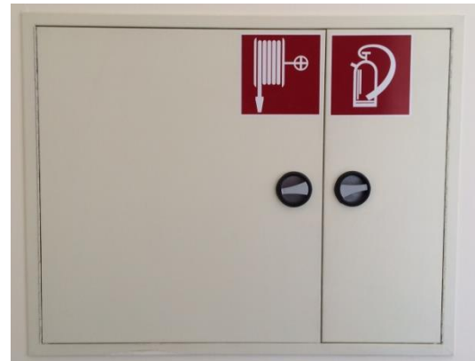
Abbildung 4: Wandhydrantenkasten

Wandhydranten sind im Gebäude installierte Wasserentnahmestellen, die zur Brandbekämpfung vorgesehen sind. Diese sind in Wandhydrantenkästen untergebracht. (siehe Abb. 4) Machen Sie sich mit deren richtigen Handhabung und Aufstellungsort vertraut. Diese sind nicht nur für die Feuerwehr vorbereitet, sondern ähnlich einem Feuerlöscher für jedermann zugänglich, um einen Brand in der Entstehungsphase bekämpfen zu können.