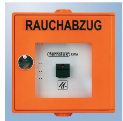
Abb. 4.2: Rauchabzugstaster

Der Rauchabzugstaster bewirkt keine automatische Alarmmeldung der Feuerwehr wie die Druckknopfmelder. Betätigen Sie daher im Ernstfall zusätzlich Druckknopfmelder und alarmieren sie die Feuerwehr via Telefon.