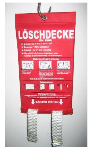
Abb. 4.3: Löschdecke