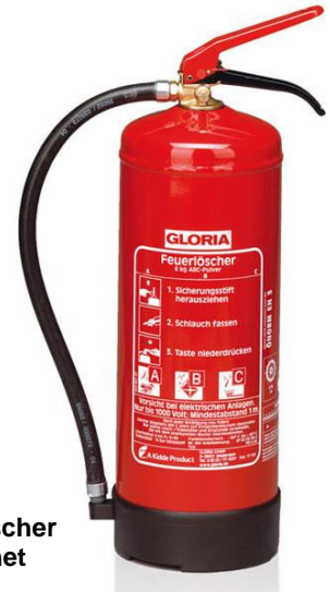
Abb. 4.1: Handfeuerlöscher