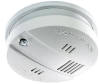
Abb. 4.4: Rauchwarnmelder

Die Melder sind batteriebetrieben, ein Kontrolllämpchen blinkt regelmäßig. Rechtzeitig vor dem Leerwerden der Batterie ertönt ein Signal. Ist diese der Fall, muss die Heimleitung verständigt werden, um die Batterie zu wechseln.