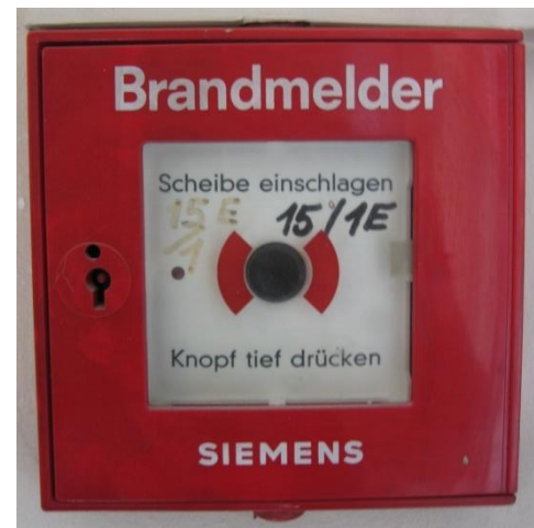
Abbildung 1: Druckknopfmelder

Im gesamten Haus sind bei den Aus- und Notausgängen sowie den Zugängen zu den Stiegen Druckknopfmelder installiert (rotes Kästchen auf weißem Hintergrund mit schwarzem Knopf, siehe Abb.1). Dieser ist durch eine Glasscheibe geschützt, die bei Gebrauch eingeschlagen werden muss. Durch anschließendes Drücken des Knopfes wird nicht nur im Haus (Sirenen) Alarm ausgelöst, sondern auch direkt und unmittelbar die Feuerwehr alarmiert. Jede(r) Bewohner(in) ist verpflichtet, sich die Lage des nächstgelegenen Druckknopfmelders einzuprägen und diesen bei Entdecken eines Brandes zu betätigen.