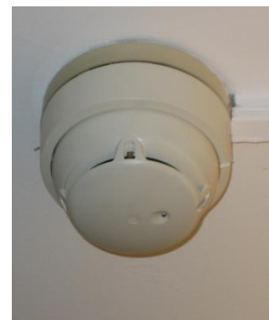
Abbildung 2: Brandmelder

Eine Fehlauslösung ist vom Verursacher, je nach Vorschreibung an die Akademikerhilfe, zu bezahlen.