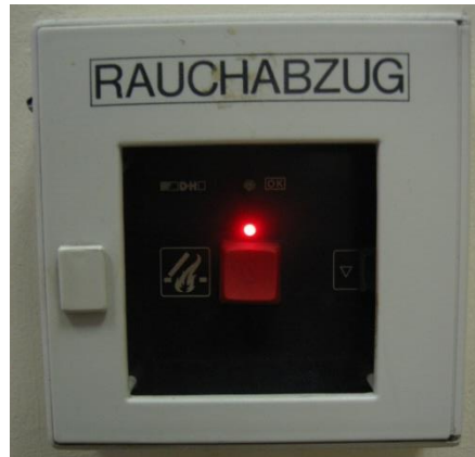
Abbildung 6: Rauchabzugstaster

Diese befinden sich in dem Bereich der Stiegen. (siehe Abb. 6) Machen Sie sich mit deren richtigen Handhabung und Aufstellungsort vertraut. Sie sind durch eine Glasscheibe geschützt, die bei Gebrauch eingeschlagen werden muss. Durch das Einschlagen und anschließende Betätigen des Druckknopfes werden die Rauchabzugsöffnungen der Stiegenhäuser aktiviert.