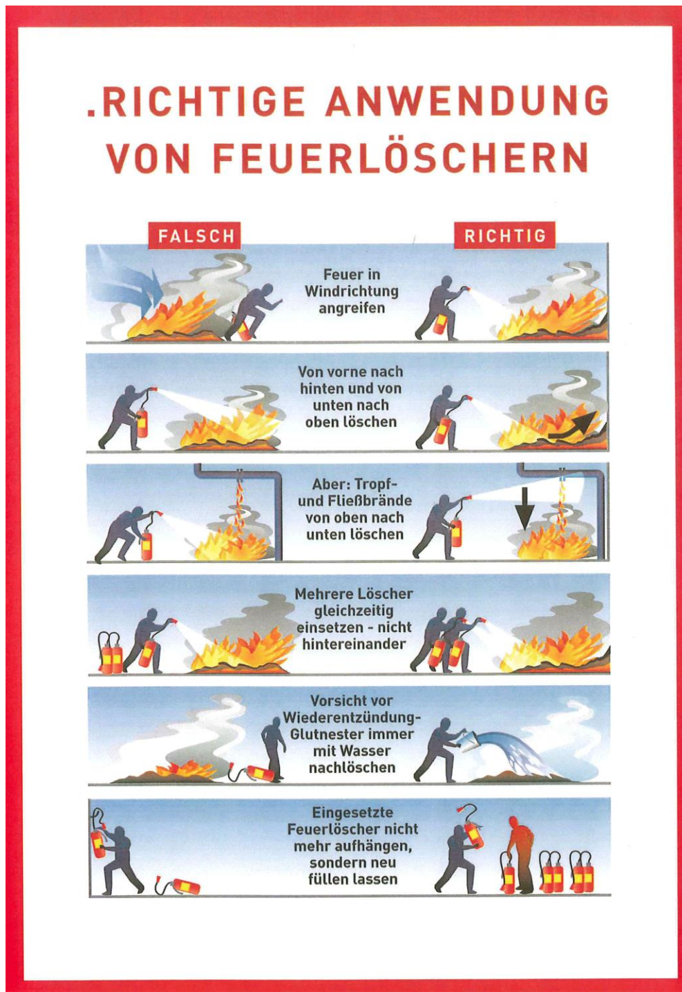
Abbildung 3: Benützung eines Handfeuerlöschers

Wichtige Hinweise bei der Benützung eines Handfeuerlöschers (Abb. 3):