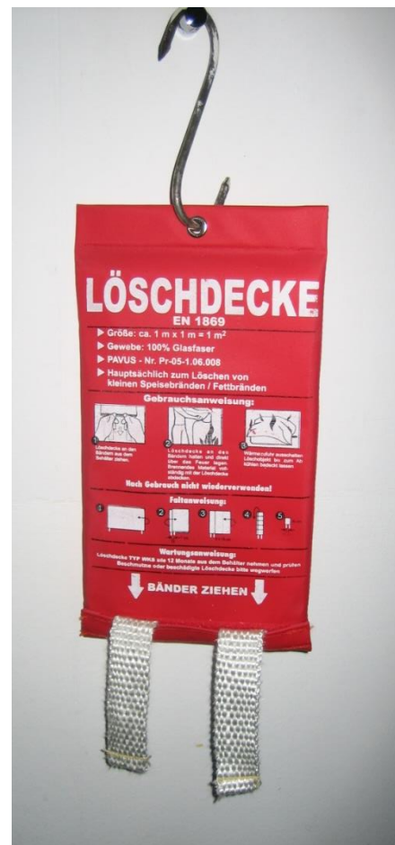
Abbildung 7: Löschdecke