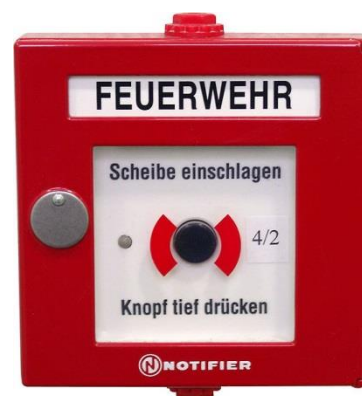
Abb. 4.1: Druckknopfmelder

Im gesamten Haus sind bei den Aus- und Notausgängen sowie den Zugängen zu den Stiegen Druckknopfmelder installiert (rotes Kästchen mit weißem Grund und schwarzem Knopf). Diese Melder lösen den Brandalarm aus. Bei Betätigung des Melders wird nicht nur im Haus (Sirene) Alarm ausgelöst, sondern auch direkt und unmittelbar die Feuerwehr alarmiert. Jede(r) BewohnerIn ist verpflichtet, sich die Lage des nächstgelegenen Druckknopfmelders einzuprägen und diesen bei Entdecken eines Brandes zu betätigen.