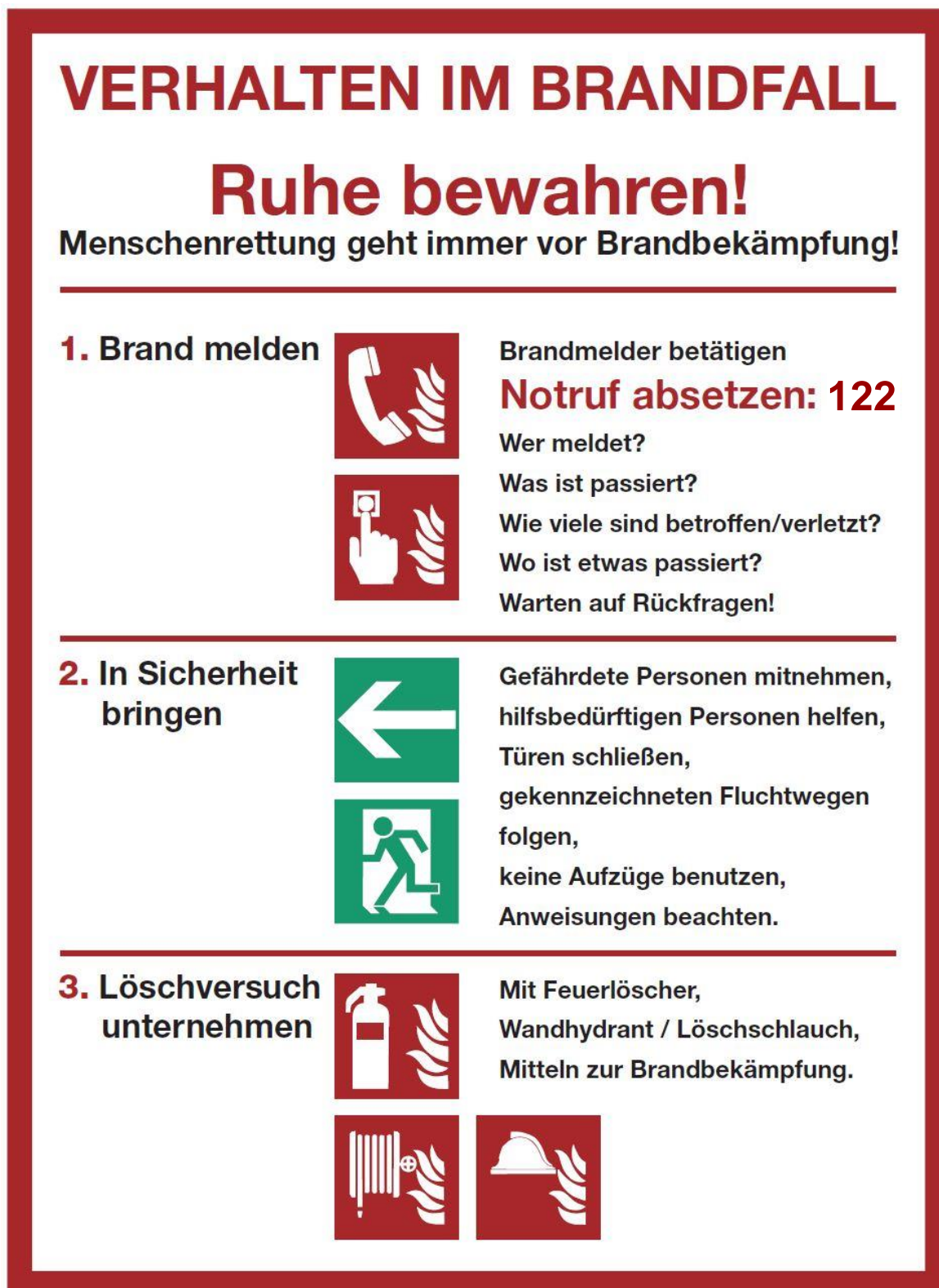
Abb. 5.2: Verhalten im Brandfall