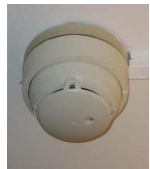
Abb. 2: Brandmelder

Im gesamten Gebäude, Gebäudeteil oder Brandabschnitt sind an der Decke automatische Brandmelder installiert. Diese Melder lösen bei einer gewissen Rauch-, Dampfkonzentration oder einer bestimmten Temperatur Brandalarm aus. Zur Vermeidung von Täuschungsalarman der Brandmeldeanlage sind die allgemeinen Brandverhütungsmaßnahmen einzuhalten. Um die Brandmelder muss ständig allseitig ein Freiraum von mindestens 50 cm gegeben sein.