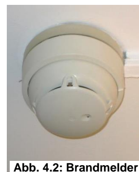
Abb. 4.2: Brandmelder

⇒ Eine Fehlauflösung ist vom Verursacher, je nach Vorschreibung, an die Akademikerhilfe zu bezahlen.