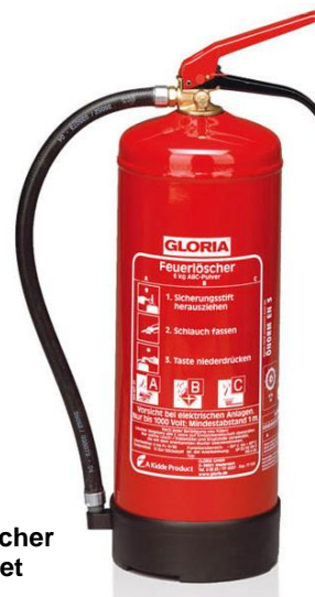
Abb. 4.3: Handfeuerlöscher Quelle: Internet