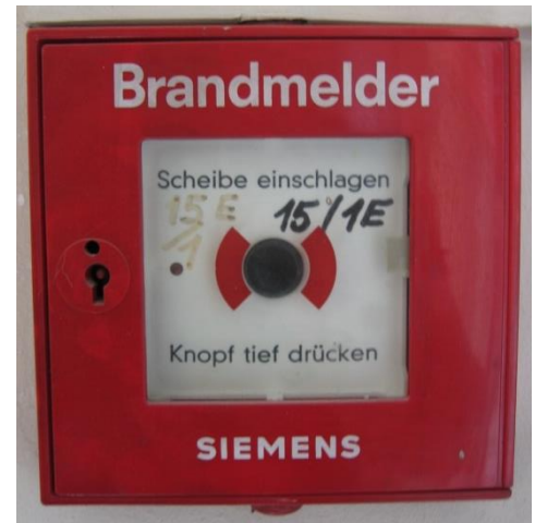
Abbildung 1: Druckknopfmelder

Im gesamten Haus sind bei den Aus- und Notausgängen sowie den Zugängen zu den Stiegen Druckknopfmelder installiert (rotes Kästchen auf weißem Hintergrund mit schwarzem Knopf, siehe Abb.1). Dieser ist durch eine Glasscheibe geschützt, die bei Gebrauch eingeschlagen werden muss. Durch anschließendes Drücken des Knopfes wird nicht nur im Haus Alarm (Sirenen) ausgelöst, sondern auch direkt und unmittelbar die Feuerwehr alarmiert. Jede(r) Bewohner(in) ist verpflichtet, sich die Lage des nächstgelegenen Druckknopfmelders einzuprägen und diesen bei Entdecken eines Brandes zu betätigen.