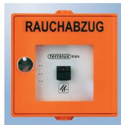
Abb. 4.4: Rauchabzugstaster

Der Rauchabzugstaster bewirkt keine automatische Alarmmeldung der Feuerwehr wie die Druckknopfmelder. Betätigen Sie daher im Ernstfall zusätzlich Druckknopfmelder und alarmieren sie die Feuerwehr via Telefon.