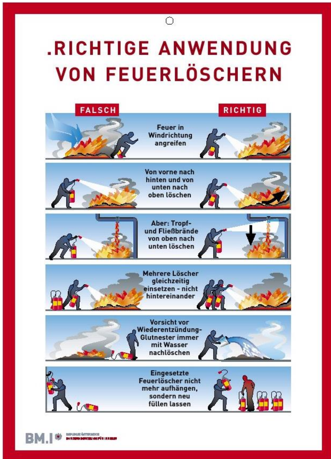
Abb. 5.1: Benützung eines Handfeuerlöschers