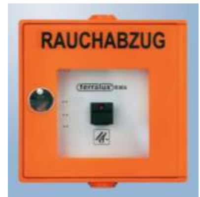
Abb. 4.2: Rauchabzugstaster

Der Rauchabzugstaster bewirkt keine automatische Alarmmeldung der Feuerwehr wie die Druckknopfmelder. Betätigen Sie daher im Ernstfall zusätzlich Druckknopfmelder und alarmieren sie die Feuerwehr via Telefon.