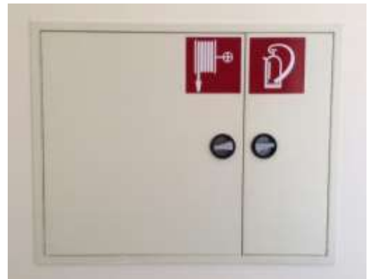
Abb. 4.4.1: Wandhydrantenkasten (hier mit Feuerlöscher kombiniert)

Machen Sie sich mit deren richtiger Handhabung und Aufstellungsort vertraut. Diese sind nicht nur für die Feuerwehr vorbereitet, sondern ähnlich einem Feuerlöscher für jedermann zugänglich, um einen Brand in der Entstehungsphase bekämpfen zu können.