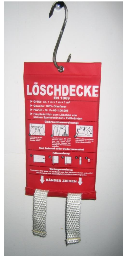
(Abb. 2: Löschdecke)