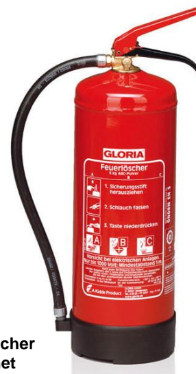
Abb. 4.2: Handfeuerlöscher