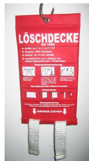
Abb. 4.3: Löschdecke