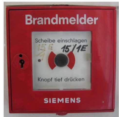
Abbildung 1: Druckknopfmelder

Im gesamten Haus sind bei den Aus- und Notausgängen sowie den Zugängen zu den Stiegen Druckknopfmelder installiert (rotes Kästchen auf weißem Hintergrund mit schwarzem Knopf, siehe Abb.1). Dieser ist durch eine Glasscheibe geschützt, die bei Gebrauch eingeschlagen werden muss. Durch anschließendes Drücken des Knopfes wird nicht nur im Haus (Sirenen) Alarm ausgelöst, sondern auch direkt und unmittelbar die Feuerwehr alarmiert. Jede(r) Bewohner(in) ist verpflichtet, sich die Lage des nächstgelegenen Druckknopfmelders einzuprägen und diesen bei Entdecken eines Brandes zu betätigen.