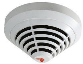
Abb. 2: Brandmelder

Im gesamten Gebäude, Gebäudeteil oder Brandabschnitt sind an der Decke automatische Brandmelder installiert. Diese Melder lösen bei einer gewissen Rauch-, Dampfkonzentration oder einer bestimmten Temperatur Brandalarm aus. Zur Vermeidung von Täuschungsalarmen der Brandmeldeanlage sind die allgemeinen Brandverhütungsmaßnahmen einzuhalten. Um die Brandmelder muss ständig allseitig ein Freiraum von mindestens 50 cm gegeben sein.