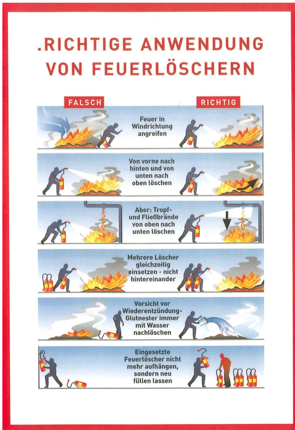
Abb. 3: Benützung eines Handfeuerlöschers

Wichtige Hinweise bei der Benützung eines Handfeuerlöschers (Abb. 3):