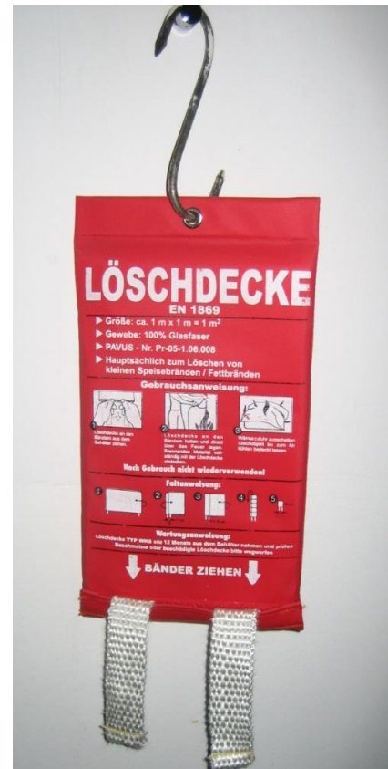
(Abb. 4: Löschdecke)