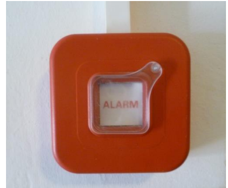
Abbildung 1: Druckknopfmelder

Im gesamten Haus sind bei den Ausgängen sowie den Zugängen zu den Stiegen Druckknopfmelder installiert (rotes Kästchen, siehe Abb.1). Der Alarmknopf ist durch eine Kunststoffscheibe geschützt, die bei Gebrauch zur Seite gedreht werden muss. Durch anschließendes Drücken des Knopfes wird nicht nur im Haus Alarm (Sirenen) ausgelöst, sondern auch direkt und unmittelbar die Feuerwehr alarmiert. Jede(r) Bewohner(in) ist verpflichtet, sich die Lage des nächstgelegenen Druckknopfmelders einzuprägen und diesen bei Entdecken eines Brandes zu betätigen.