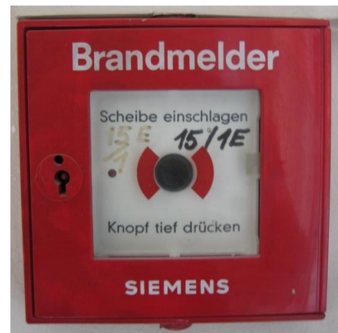
Abbildung 1: Druckknopfmelder

Im gesamten Haus sind bei den Aus- und Notausgängen sowie den Zugängen zu den Stiegen Druckknopfmelder installiert (rotes Kästchen auf weißem Hintergrund mit schwarzem Knopf, siehe Abb.1). Dieser ist durch eine Glasscheibe geschützt, die bei Gebrauch eingeschlagen werden muss. Durch anschließendes Drücken des Knopfes wird nicht nur im Haus (Sirenen) Alarm ausgelöst, sondern auch direkt und unmittelbar die Feuerwehr alarmiert. Jede(r) Bewohner(in) ist verpflichtet, sich die Lage des nächstgelegenen Druckknopfmelders einzuprägen und diesen bei Entdecken eines Brandes zu betätigen.