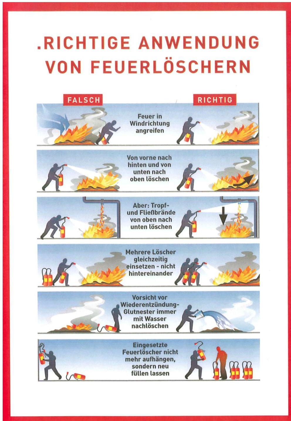
Abbildung 3: Benützung eines Handfeuerlöschers

Wichtige Hinweise bei der Benützung eines Handfeuerlöschers (Abb. 3):