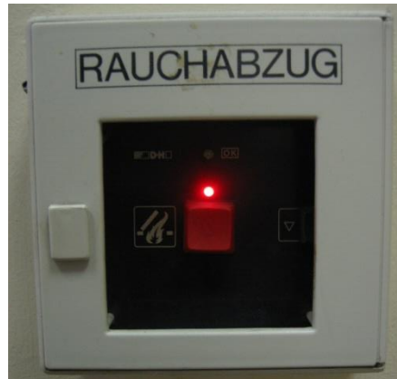
Abbildung 6: Rauchabzugstaster

Diese befinden sich in dem Bereich der Stiegen. (siehe Abb. 6) Machen Sie sich mit deren richtigen Handhabung und Aufstellungsort vertraut. Sie sind durch eine Glasscheibe geschützt, die bei Gebrauch eingeschlagen werden muss. Durch das Einschlagen und anschließende Betätigen des Druckknopfes werden die Rauchabzugsöffnungen der Stiegehäuser aktiviert.