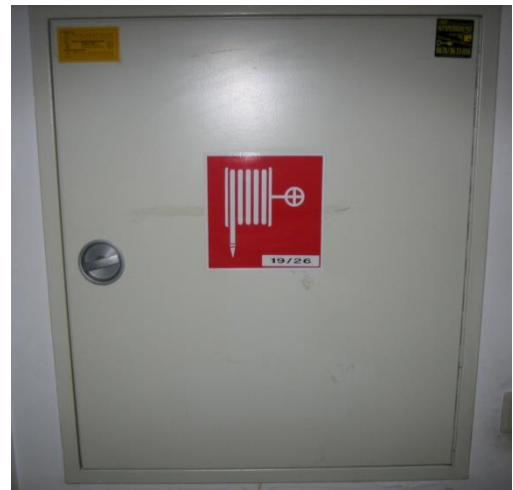
Abbildung 4: Wandhydrantenkasten

Wandhydranten sind im Gebäude installierte Wasserentnahmestellen, die zur Brandbekämpfung vorgesehen sind. Diese sind in Wandhydrantenkästen untergebracht. (siehe Abb. 4) Machen Sie sich mit deren richtigen Handhabung und Aufstellungsort vertraut. Diese sind nicht nur für die Feuerwehr vorbereitet, sondern ähnlich einem Feuerlöscher für jedermann zugänglich, um einen Brand in der Entstehungsphase bekämpfen zu können.