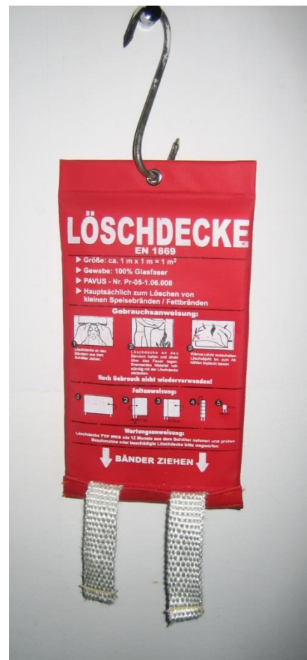
Abbildung 7: Löschdecke