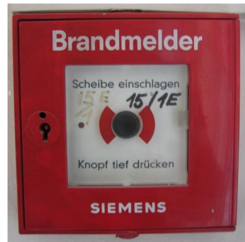
Abbildung 1: Druckknopfmelder

Im gesamten Haus sind bei den Aus- und Notausgängen sowie den Zugängen zu den Stiegen Druckknopfmelder installiert (rotes Kästchen auf weißem Hintergrund mit schwarzem Knopf, siehe Abb.1). Dieser ist durch eine Glasscheibe geschützt, die bei Gebrauch eingeschlagen werden muss. Durch anschließendes Drücken des Knopfes wird nicht nur im Haus (Sirenen) Alarm ausgelöst, sondern auch direkt und unmittelbar die Feuerwehr alarmiert. Jede(r) Bewohner(in) ist verpflichtet, sich die Lage des nächstgelegenen Druckknopfmelders einzuprägen und diesen bei Entdecken eines Brandes zu betätigen.