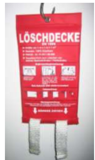
Abb. 4.3: Löschdecke