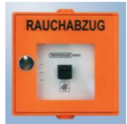
Abb. 4.2: Rauchabzugstaster

Der Rauchabzugstaster bewirkt keine automatische Alarmmeldung der Feuerwehr wie die Druckknopfmelder. Betätigen Sie daher im Ernstfall zusätzlich Druckknopfmelder und alarmieren sie die Feuerwehr via Telefon.