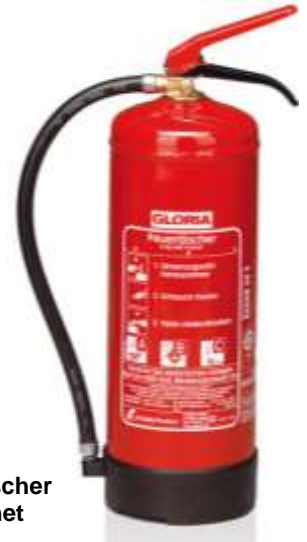
Abb. 4.1: Handfeuerlöscher