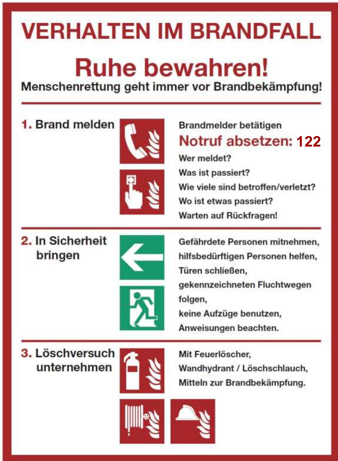
Abb. 5.2: Verhalten im Brandfall