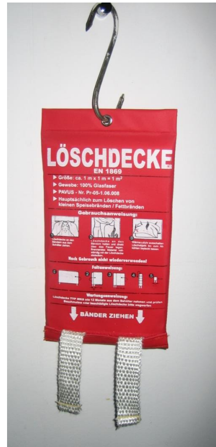
(Abb. 2: Löschdecke)