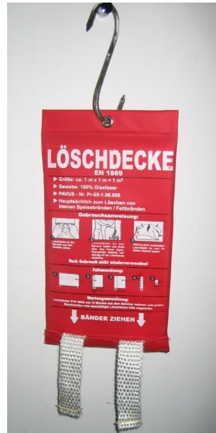
(Abb. 2: Löschdecke)